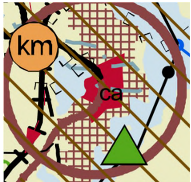
Kuva 2. Ote maakuntakaavan tarkistuksesta.

Keski-Suomen maakuntavaltuusto on hyväksynyt maakuntakaavan tarkistuksen kokouksessaan 1.12.2017. Samalla on kumottu kaikki aiemmat maakuntakaavat. Tarkistus koskee Keski-Suomen maakuntakaavaa, 1., 2., 3. ja 4. vaihemaakuntakaavaa sekä Pirkanmaan 1. maakuntakaavaa Jämsän Länkipohjan osalta. Kaavoitusprosessin yhteydessä on arvioitu voimassa olevia kaavoja ja tarkistus on koskenut kaikkia maakuntakaavan teemoja: asutusrakennetta, liikennettä, teknistä huoltoa, luonnonvaroja, erityistoimintoja, kulttuuriympäristöä, luonnonsuojelua ja virkistystä. Lopputuloksena on saatu kaikki voimassa olevat maakuntakaavat korvaava Keski-Suomen tarkistettu maakuntakaava.