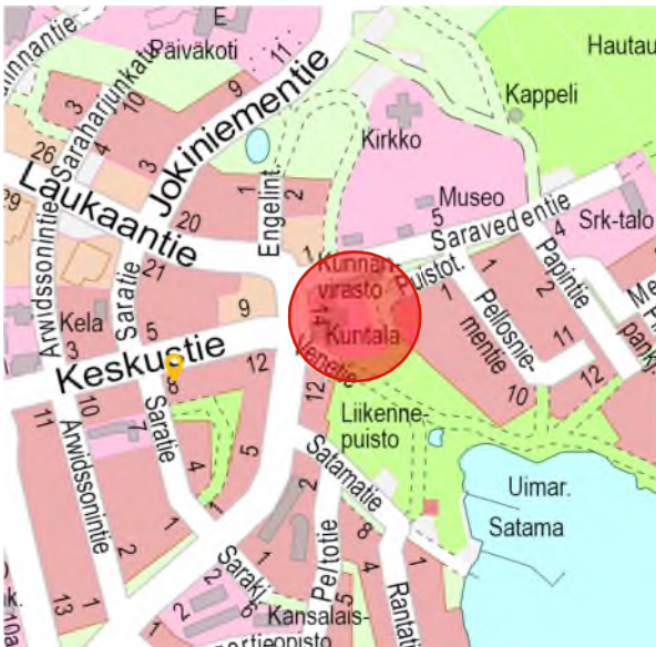
Kuva 1. Suunnittelualueen sijainti.

Suunnittelualue käsittää korttelin 65 sekä siihen liittyvät pysäköinti-, lähivirkistys- ja puistoalueet sekä jalankululle ja polkupyöräilylle varattua katu/tietä. Korttelin alueelle sijoittuu kunnanvirasto Kuntala. Asemakaavan muutos koskee kiinteistöä Kuntala 410-409-53-9 sekä yleisiä alueita 410-1-9910-1 ja 410-1-9903-2. Alue liittyy Laukaantie, Saravedentie ja Venetie nimisiin katualueisiin. Suunnittelualueen pinta-ala on noin 1,2 ha. Asemakaavan muutoksen lopullinen rajausta tarkentuu suunnittelutyön aikana.